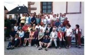
800 ème ANNIVERSAIRE DE SAINT LUDAN FÊTES ANNUELLES DU 12 AU 16 JUILLET 2000 Bénévoles bénévoles et de nombreux habitants de St-Ludan